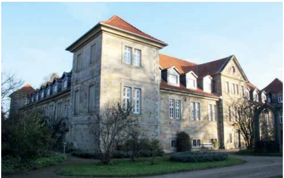
Das Kloster Barsinghausen von außen.