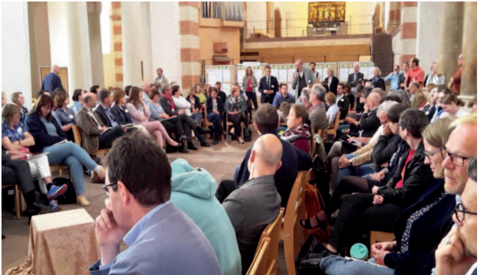
„Wir reiten die Welle“ - Tagung für Pastoren*innen in Hildesheim