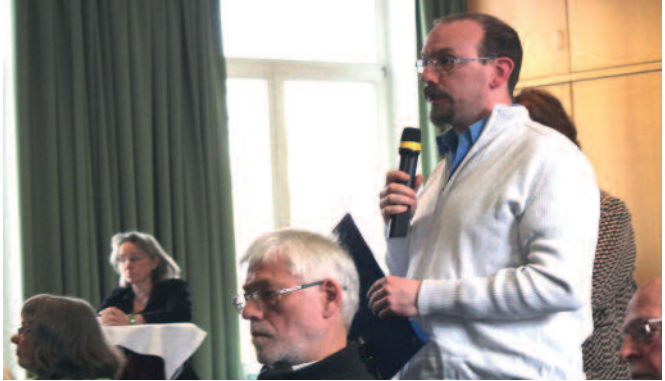
Aus dem Plenum heraus gibt es zahlreiche Nachfragen, Einwendungen und Erwartungen an eine neue Kirchenverfassung.

Im Absatz „Auftrag der Landeskirche“ Absatz (2) heißt es: „Die Landeskir-