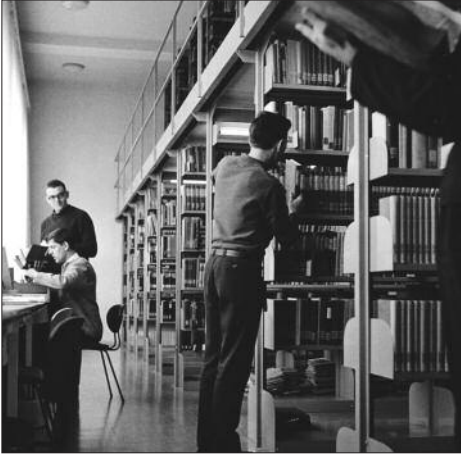
Eine umfangreiche Bibliothek umfasste alle Gebiete der Theologie.

Kleiner Nebeneffekt des Schreibens der „Celler“ war, dass die Rückmeldung von einigen dort Ausgebildeten kam: sie hätten sich gefreut, dass durch den Brief ihre alte Ausbildungsstätte, die sie zu Pastoren*innen ausgebildet hatte, auf diese Weise ein Stück aus der Vergessenheit geholt wurde. Es ehrt die Landeskirche Hannovers nicht, dass sie diese Ausbildung, auf die sie hätte stolz sein können, damals so sang- und klanglos abwickelte. Ich hatte mich damals an den amtierenden Landesbischof gewandt und eine Abschlussfeier mit entsprechender Würdigung - der dort geleisteten Arbeit vorgeschlagen. Aber es kam nichts.