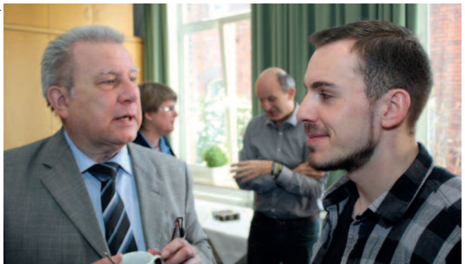
In der Pause wird weiterdiskutiert - auch zwischen den Generationen und ihren Sichtweisen.

che nimmt den Auftrag der Kirche in ihrem Bereich in eigener Verantwortung wahr. Sie erfüllt Aufgaben, die wegen ihres Umfangs oder ihrer Wirkung von den Kirchengemeinden und Kirchenkreisen nicht hinreichend erfüllt werden können oder die aus anderen Gründen auf die Landeskirche übertragen werden.“ In der Erklärung heißt es unter dem Stichwort „Subsidiarität“: „...dass die landeskirchliche Ebene immer dann, aber auch nur dann für eine Aufgabe zu-