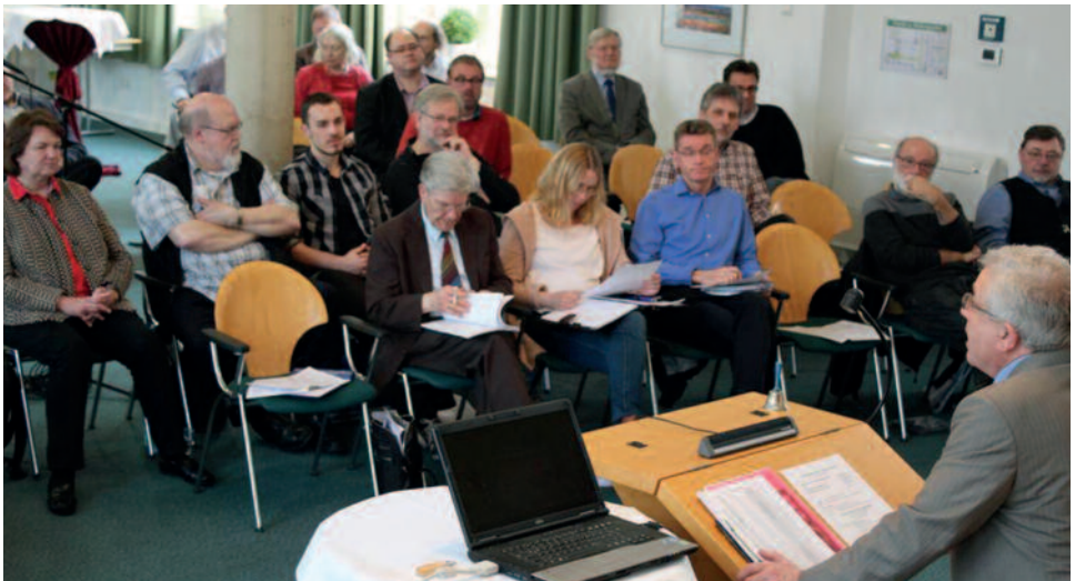
An die thematischen Diskussionen des Pfarrvereinstages zur neuen Verfassung schloss sich die Mitgliederversammlung an