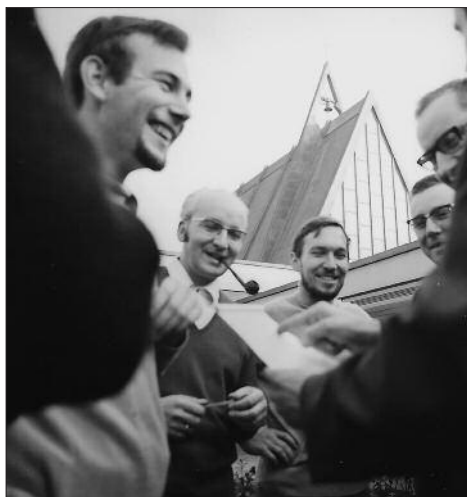
Studenten der Theol. Akademie Celle im Gespräch mit ihrem Dozenten.

Sehr geehrte Herren, Ihre Nachricht hat das Büro des Ratsvorsitzenden erreicht. Bitte entschuldigen Sie die verzögerte Antwort. Danke für Ihr Mitdenken und Mitbeten in Bezug auf den theologischen Nachwuchs in unserer Kirche!