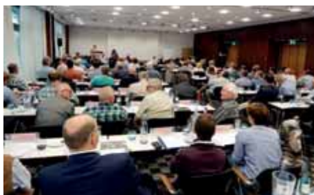
Mitgliederversammlung der Delegierten aus den Pfarrvereinen der Landeskirchen