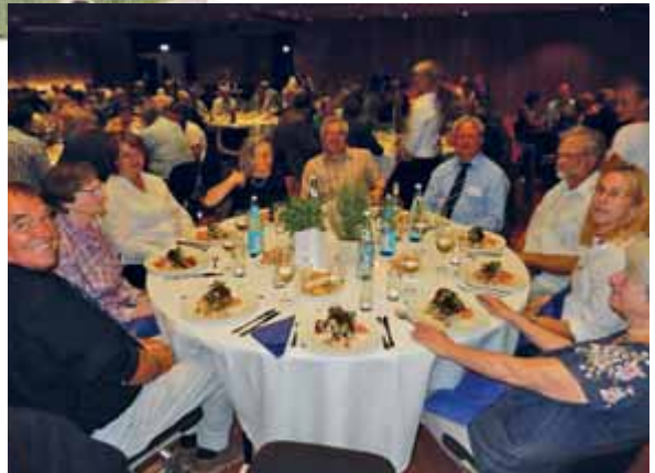
Zwei Tische mit Hannoveranern beim festlichen Begrüßungsabend