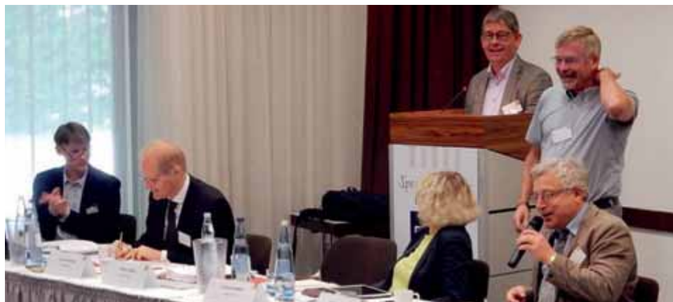
Unser Verbandsvorstand bei der Arbeit