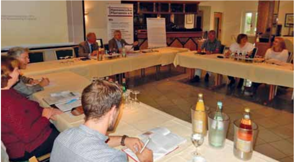
Versammlung der Sprecher*innen des Hannoverschen Pfarrvereins.