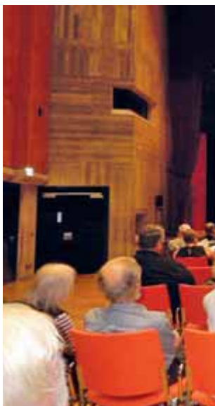
Festvortrag im Kongresszentrum