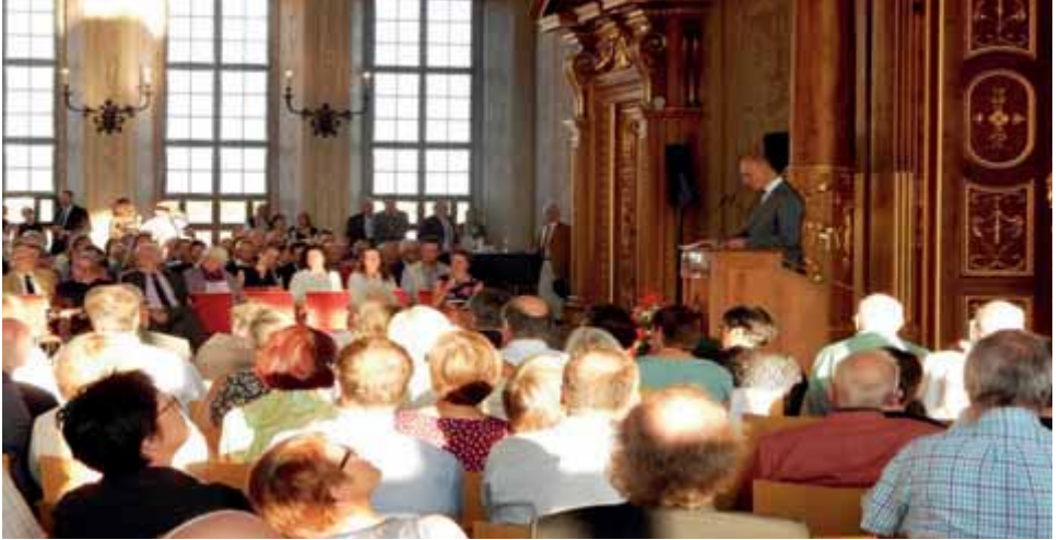
Empfang im Goldenen Saal des Augsburger Rathauses durch Oberbürgermeister Kurt Gribl