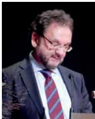
Vortrag von Dr. Heribert Prantl, Chefredakteur der Süddeutschen Zeitung, zum Thema des Pfarrertages: Religion und Gewalt