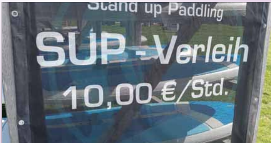
Gesehen im Küstenbadeort Neuharlingersiel von Rosemarie Giese.