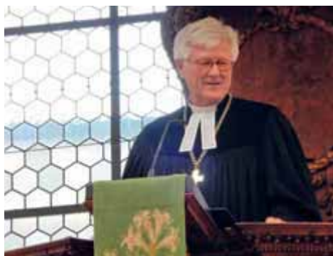
Bayrischer Landesbischof und EKD Rats-Vorsitzender Bedford-Strom hielt eine beeindruckende Predigt über Gewalt in der Bibel