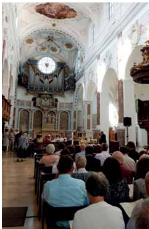
Eröffnungsgottesdienst in St. Anna