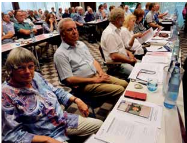
Die Delegierten aus Hannover