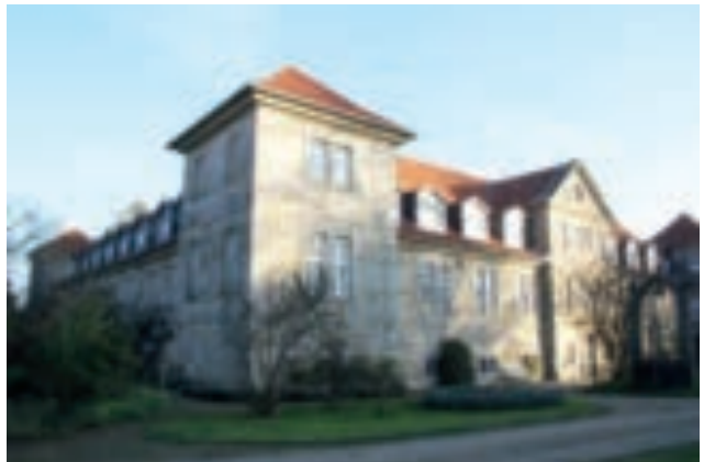
Wer am Limit ist, der kann im Haus inspiratio im Kloster Barsinghausen eine begleitete Auszeit nehmen.

Beitrag vom 10. Dezember 2018 in „kirchenbunt“