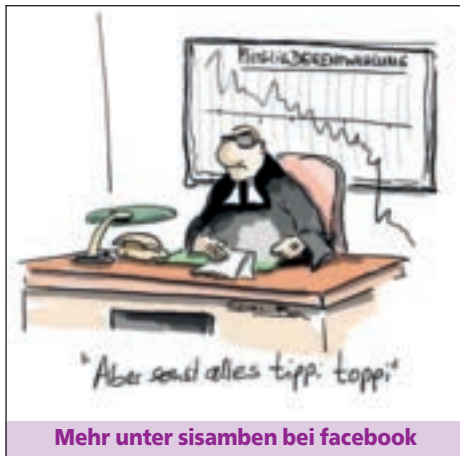
Mehr unter sisamben bei facebook

Die kirchlichen Finanzen hat dieser Schwund jedoch nicht erodieren lassen. Im Gegenteil: Nach einer kurzen Delle aufgrund der Finanzkrise und des resultierenden Abschwungs sind die Kirchensteuereinnahmen seit 2010 Jahr für Jahr gestiegen – bei den Katholiken etwas stärker als bei den Protestanten. Da die Steuereinnahmen nominal sind, ist das Plus grundsätzlich nicht überraschend. Die Einnahmenezuwächse fallen jedoch deutlich höher als die Inflationsrate aus, so dass die Kirchen auch real Zuwächse verbuchen. Dies hat im Wesentlichen zwei Gründe: Zum einen ist die Lohnsumme als Folge der hohen Beschäftigung deutlich gestiegen, zum an-