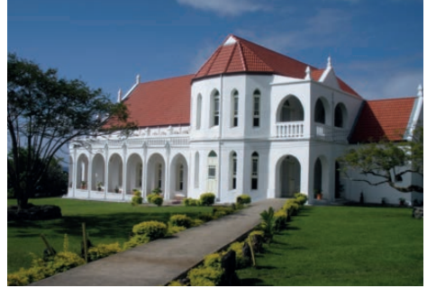
Piula Theological College, Upolu island, Samoa

Auf der Hauptinsel Upolo gibt es noch eine zweite theologische Hochschule, die der evangelisch-methodistischen Kirche. Sie wurde vor 150 Jahren als „Piula Theological College“ gegründet und dient ebenfalls als Studienplatz für deren Pastoren, die auch auf Tonga und Fidschi sowie in den Auswanderergemeinden in Australien und Neuseeland Dienst tun. Bei einer Gesamtbevölkerung von fast 200 000 Einwohnern Samoas gehören dieser Kirche 15% an, wobei 98% aller Samoaner Christen sind. Es gibt nur eine einzige muslimische Familie. Zur röm.-kath. Kirche bekennen sich 20%.