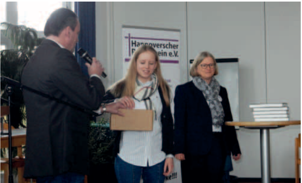
Am Rande des Hannoverschen Pfarrvereinstages verloste der Versicherer im Raum der Kirchen vrk zehn Exemplare der Nordsee-Bibel „Auf großen Wassern“ mit Bildern des Malers Hermann Buß.