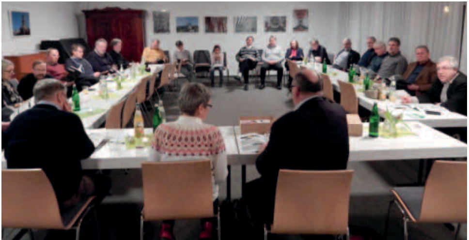
Intensive Beratungen im Gemeindesaal der ref. Kirche Aurich

(Evangelische Kirche Berlin–Brandenburg–schlesische Oberlausitz) Noch gibt es eine gute Abdeckung der Gottesdienste durch Nachwuchs sowie durch Predikanten und Lektoren. Immer wieder ist das Verhältnis zur AfD Thema. Oft gerät Kirche hier zwischen die Fronten. Auch gestaltet sich die Schnittstelle zwischen Kirche und Schule (Religionsunterricht) immer noch schwierig. Durch zwei Todesfälle und drei Rücktritte wurde der Vorstand dezimiert. Auch hier hofft man auf den Nachwuchs. Auch die Begrifflichkeit innerhalb der Kirche ändert sich in Richtung von Organisationsformen der Wirt-