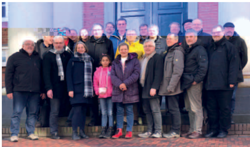
Die Teilnehmer der „Nordschiene“ vor der ev.-ref. Kirche Aurich

Dass die Mitgliederzahl im Pfarrverein rückläufig ist, ist ein Indikator dafür, dass Veränderungen anstehen. Die Pfarerschaft ist deutlich überaltert. Vikare ziehen es oft vor, sich in andere Landeskirchen zu bewerben. Die Personallücke wird größer. Die Folge: in einer nicht eben kleinen Kirchengemeinde wird nur noch einmal in vier Wochen ein Gottesdienst angeboten. Es schleicht sich Müdigkeit ein, Frustration wird spürbar. Der Druck seitens der mittleren Ebene steigt, bietet aber keine Idee, wo denn die Kapazitäten