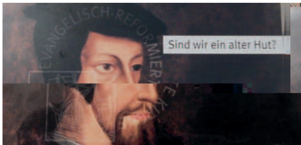
Eine Frage, die sich viele Christen stellen...

Gesellschaftliches Engagement: „Wo sollen wir uns gesellschaftlich als Ge-