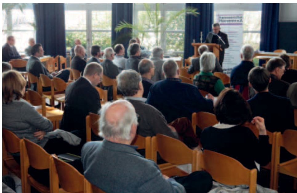
Plenum des Pfarrvereinstages 2020.

Pfarramt erfolgen sollten. Ihm ist auch klar, dass eine solche Umstellung erhebliche rechtliche Voraussetzungen impliziert, die er auch ausführlich diskutiert. Aber nicht darauf will ich hier eingehen sondern darauf, wie er im Blick auf unsere hier angesprochene Diskussionslage seinen Vorschlag begründet. So heißt es bei ihm: „Die Umstellung der Erklärung des Kirchenaustritts vom Standesamt oder Amtsgericht aufs Pfarramt wird die Zahl der Kirchenaustritte nicht wesentlich verringern. Aber sie macht aus dem Pfarrer als hilflosen Beobachter von Austritt um Austritt einen Handelnden, einen Beteiligten. Der Pfarrer wird mehr über die Ursachen der Kirchenaustritte erfahren, mehr über seine Gemeinde, mehr über die Menschen, die zur Gemeinde gehören, aber nicht am Leben der Gemeinde teilnehmen. Er wird manchmal erleben,