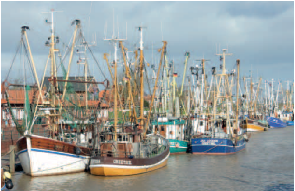
Nach vielen Regentagen endlich Sonnenschein beim kurzen Ausflug in das Fischerdorf Greetsiel

Der Verein beobachtet mit Spannung, wie sich die neue Synode (2020–2025) künftig positionieren wird (2/3 neue Synodale!). Viele gerade jüngere Frauen sind neu hinzugewählt worden, zahlreiche zuvor einflussreiche Synodale wurde abgewählt (10). Was das künftig für die Pfarrerschaft und die Gemeinden bedeuten wird, ist noch nicht abzusehen. Gerade fand die Konstituierung mit den Ausschusswahlen statt. Salopp könnte man sagen: das Verhältnis der Pfarrerschaft zu ihren synodalen Vertretern kann eigentlich nur besser werden, zumal auch zwei Pfarrvertretungs-Mitglieder in die Synode gewählt wurden! – In die lange schon schwärende und bisher ergebnislose Diskussion um die immer schwieriger werdende pastorale Versorgung strukturschwacher Gebiete scheint Bewegung bis