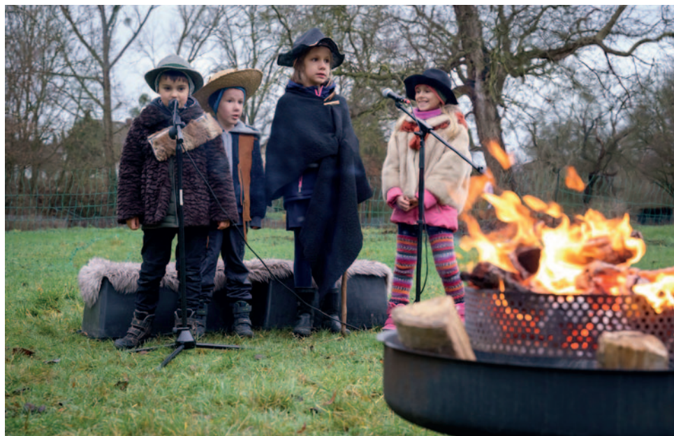
Bewegtes Krippenspiel in Klein Berkel

Der traditionelle Kantatengottesdienst am 2. Weihnachtstag in der Marktkirche St. Nicolai wurde zweimal (10 und 12