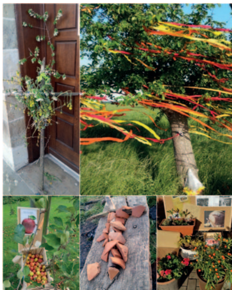
Stationen der „Spazierandacht“

Premiere hatte das Format am Oster-sonntag 2020, weitere gab es bislang zu Pfingsten, Erntedank, Advent und Neujahr. Eine Spazierandacht als Alternative zu einer Hausandacht orientiert sich am ehesten an der Idee eines Stationenwegs oder Pilgerwegs. Die Stationen sind kurze Haltepunkte in der Natur. Sie brauchen