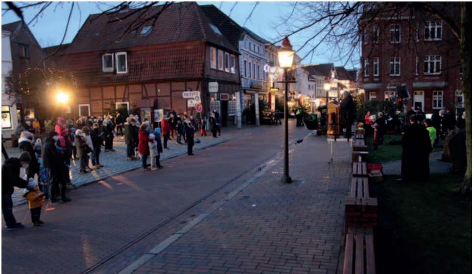
Gottesdienst vor St.-Petri

Stadt (ACK) organisiert worden, unterstützt von Bauhof, Ordnungsamt, Gesundheitsamt und Feuerwehr. Das alles unter Einhaltung der Hygiene- und Abstandsregeln. Auch für diese Aktion