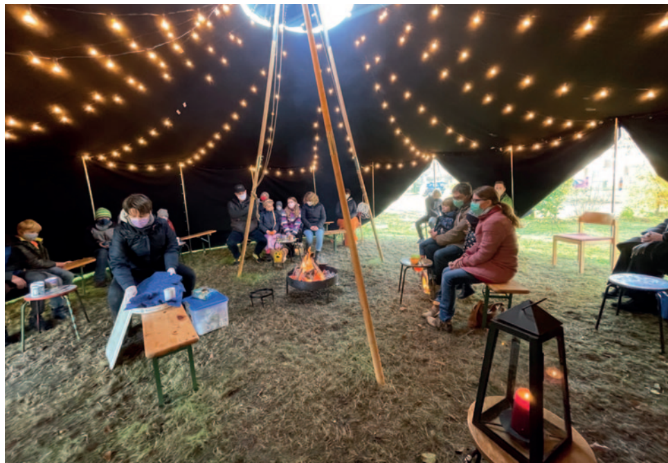
Mit Konfirmanden in der Jurte

schönem Wetter draußen im Garten Gottesdienst gefeiert und Konfirmandenunterricht erteilt haben, diese aber wegen des wechselhaften und oft feuchten ostfriesischen Klimas oft kurzfristig ausfallen mussten, bauten wir unsere Jurte auf, um dort wenigstens den Kindern und Jugendlichen Treffen zu ermöglichen. Wir stellten fest, dass auch Eltern und Großeltern beim Bringen und Abholen gern verweilen, sich ans Feuer setzten, aßen und tranken. Wir kamen rund ums Feuer immer wieder schnell, einfach und oft intensiv ins Gespräch. Feierten wir in den Jahren vorher nur besondere Gottesdienste am offenen Feuer, luden wir ab Juli