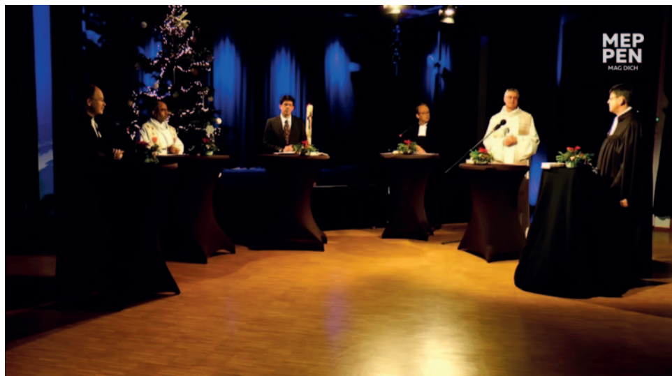
Ökumenischer Gottesdienst am Heiligabend auf Youtube

Der Einfallsreichtum der Kinderkirchenteams und der Familienkreise war sehr groß. Wenn am Ende hier wegen der öffentlichen Regelungen etwas abgesagt werden musste, dann war das nicht dem Konzept geschuldet, vielmehr der Sorge, dass vor oder nachher etwas sein könnte, nicht während der Veranstal-