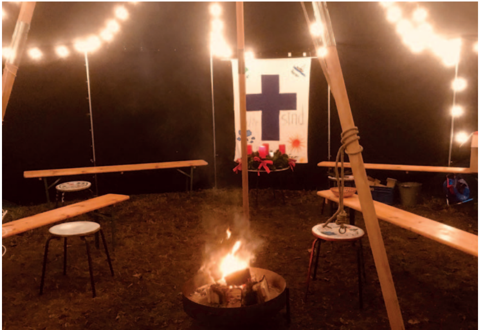
Jurte in der Weihnachtszeit

Die Gottesdienste waren sehr bunt, oft mit vielen Kindern und Jugendlichen und zu besonderen Anlässen gab es Stockbrot, Popcorn und Punsch. Hierzu entwickelten wir Hygienepläne, die genau den Zugang zum Feuer und die Austeilung von Getränken und Essen regelten. Als es dann im Oktober kälter wurde, schafften wir Isomatten und Decken an - auch zu ihrer Verwendung wurde ein Hygieneplan entwickelt - und feierten jeden Gottesdienst