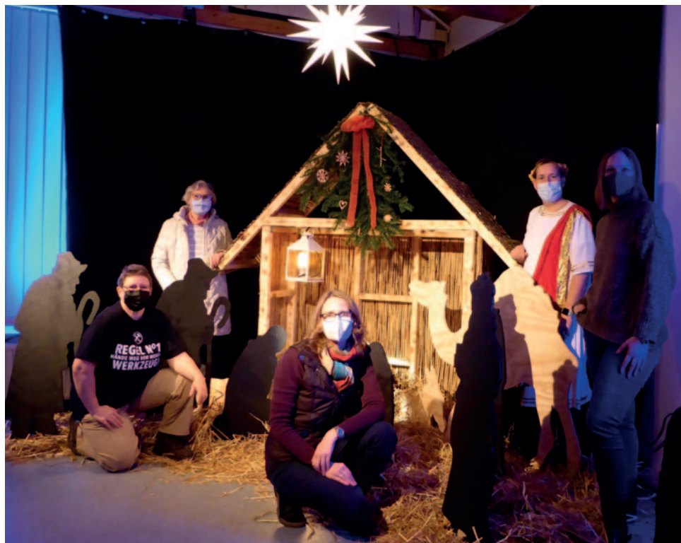
Vorbereitungsteam der KG Friedeburg vor der Krippe

Auch die Vorbereitungen gingen Mitte Dezember in die heiße Phase. Genau eine Woche vor Heiligabend begann der Aufbau der Stationen im Kirchzentrum. Für den 22. Dezember war eine „Generalprobe“ angesetzt, um auf jeden Fall rechtzeitig fertig zu werden und noch ein bisschen Zeit für den letzten Feinschliff zu haben. Zudem wurden die Stationen von einem Licht und Tontechniker, der Teil des Teams war, stimmungsvoll in Szene gesetzt.