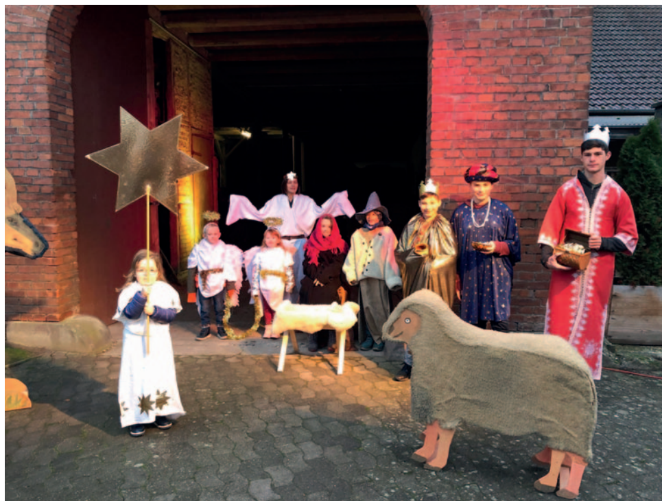
Bewegtes Krippenspiel 24.12.2020 in Klein Berkel