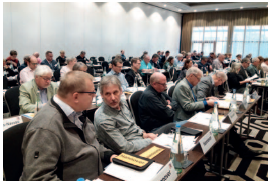
Ein Blick auf unsere Hannoverischen Delegierten.

nicht das Vertrauen in Gott unterminieren. Und vielleicht kann die Sache auch mal so gesehen werden: Knapp fünfzig Prozent der Bevölkerung ist Mitglied einer der großen Kirchen? Das ist ja richtig viel!" so Kahnt vor den Delegierten.