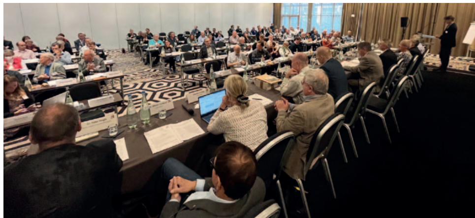
Der Vorstand und die Delegierten auf der Mitgliederversammlung.

Unlösbares Dilemma aushalten: Einerseits alles für den Frieden tun zu wollen, es aber ohne Waffen nicht zu können