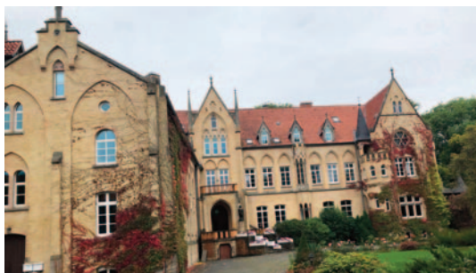
Ehemaliges Predigerseminar Schloss Imbshausen.

deutlich Ergrauten. Vielleicht auch ganz gut, dass dieser Tagungsort nicht nur außerhalb unserer Landeskirche lag, sondern sogar auf der anderen Seite der damaligen Grenze, die sich unvorhergesehen einst aufgetan hatte. So konnte die Nostalgie dann doch nicht übermächtig werden und ein gewisser Abstand zum Ort des Geschehens blieb gewahrt. – Immerhin gut die Hälfte unseres Kurses waren der Einladung gefolgt, die die Organisatorinnen uns geschickt hatten. Genug, um aus vielfältiger Perspektive, wenngleich nicht unter Einbeziehung aller, Rückschau zu halten und zu resümieren, was das Leben und drei Jahrzehnte pfarramtliche Existenz mit uns seitdem angestellt hatten. Erstaunlich, dass man im Großen und Ganzen der – oder dieselbe geblieben und die vermutete déformation professionnelle doch anscheinend nicht übermächtig geworden war – wie man es ja durchaus hätte befürchten können! Einige konnten sogar schon aus der Perspektive der Ruheständler auf ihre Aktivzeit zurückblicken, andere rechnen sich ihre Termine bereits aus, man fragte sich gegenseitig nach angedachten oder vorbereiteten Ruhestandsdomizilen und dem, was da wohl noch kommen mag an Lebensprojekten und Vorhaben.