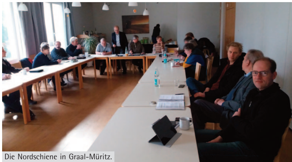
Die Nordschiene in Graal-Müritz.

che, die einfach mal wieder klönen woll- ten. Das Pfarrvereinsblatt erscheint 1x im Jahr. Auch die Nachfolge der Vertreter und Vertreterinnen aus den Kirchenkrei- sen ist schwierig geworden, weil gerade die jungen Menschen nicht mehr bereit sind, zu kandidieren. Das Verhältnis zur Kirchenleitung ist angespannt. Es sind in der Vergangenheit viele Stellen dort ge- strichen worden. Jetzt fehlen sie. Deshalb behilft man sich mit Nebenamtlichen. Die Pfarrvertretung besteht aus sieben Mit- gliedern. Die Vorsitzende hatte eine 0,25 Freistellung, aber hat nach kurzer Zeit dieses Amt wieder aufgegeben. Es ist schwer einen Nachfolger zu finden. Die Kirchenräume sollen umstrukturiert und in Regionen aufgeteilt werden. Das Ter- minstundenmodell soll angewandt wer- den, wobei aber noch unklar ist, ob dies eine Erleichterung ist, oder eben das Ge- genteil. Die Personalabteilung will Jah- resgespräche für die Pfarrerschaft ein- führen. Die 60er Regelung wird voraussichtlich wieder mehr Vakanzen