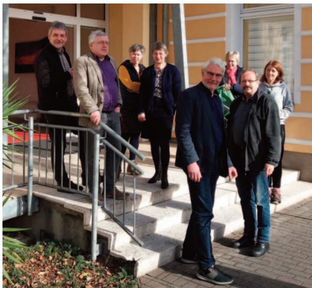
Die Sonnenstrahlen locken nicht nur Raucher vor die Tür.

viert. Für Teildienstler und da, wo keine Pfarrhäuser vorhanden sind, ist die Residenzpflicht aufgehoben. Vor 14 Jahren wurde in Bremen ein Punktsystem für die haupt- und nebenamtlichen Beschäftigten in den Ortsgemeinden eingeführt. Bei Fusionen von Gemeinden stört dies System und deshalb hat man beschlossen, die ehemals 14 Punkte pro Gemeinde auf einen Sockelbetrag runterzufahren. Von den derzeit 70 Gemeinden will man auf 20 Gemeinden abschmelzen! Früher war die Buchführung in den Ortsgemeinden angesiedelt. Jetzt soll sie durch die Regionalisierung verlagert werden, was viel Ärger bereitet. Der Verein leidet sehr unter Mitgliederrückgang, auch wenn im Vorstand jetzt ein ganz junger Kollege Mitglied ist. Eigentlich müsste der Mitgliedsbeitrag von derzeit 5€/Monat erhöht werden, um bei Sterbefällen von Mitgliedern den Hinterbliebenen 500€ zahlen zu können. Eine Beitragserhöhung