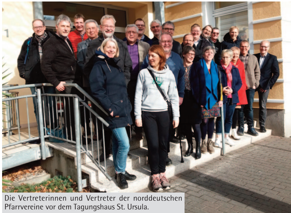
Die Vertreterinnen und Vertreter der norddeutschen Pfarrvereine vor dem Tagungshaus St. Ursula.