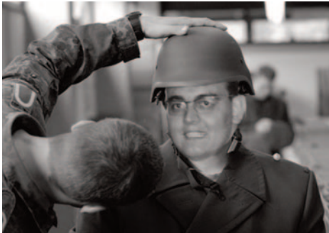
Nur eine Fotomontage: Ob mir, als zutiefst zivilem Menschen, dieser Helm gestanden hätte?

Inzwischen war ich gemustert worden, es stand die Bundeswehr an. Wenn Du schon hin musst, so dachte ich mir, dann gehst Du nicht nur für 1 1/2 Jahre als Wehrpflichtiger, dann verpflichtest du dich für zwei Jahre und bekommst Geld dafür, vielleicht kannst du auf diesem Wege auch beruflich weiterkommen.