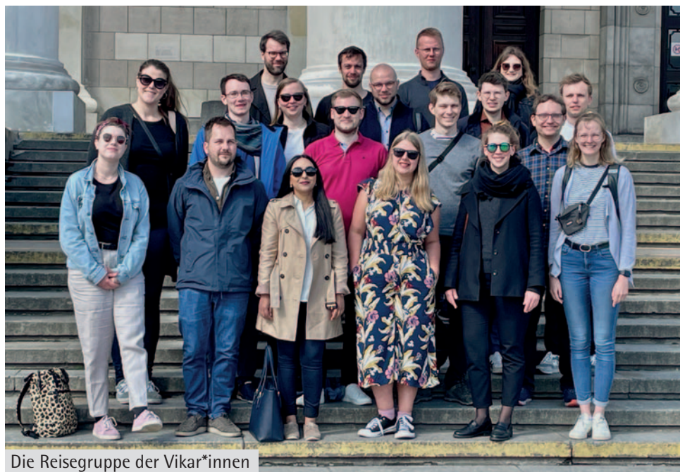
Die Reisegruppe der Vikar*innen

Außerdem haben wir am Donnerstag eine Führung auf dem Gebiet des Warschauer Ghettos gemacht. Unser Hotel, am südlichen Rand des Ghettos gelegen, diente