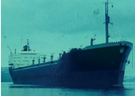
MS "Frigga" für fünf Wochen mein Zuhause

schwedische Erz aus Kiruna geladen hatten, ging es zur Entladung nach Rotterdam.