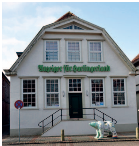
Mein Ausbildungsplatz: Geschäftsstelle „Anzeiger für Harlingerland“

wunsch, Journalist zu werden. Wahrscheinlich aus einem romantisch verklärten und von Hollywoodfilmen geprägten Bild, in dem der Journalist stets Kämpfer für die Wahrheit, die richtige Sache und das Gute ist. „Dazu sind Sie mit ihren 16 Jahren noch zu jung. Machen Sie doch erst einmal eine Lehre als Verlagskaufmann, danach können Sie dann weitersehen!“, so der Rat des obersten Chefs der Tageszeitung mit Verlag, bei dem ich mich bewarb.