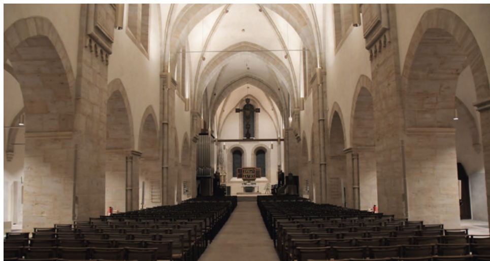
Klosterkirche Loccum, der Tagungsort

So wurde diese Synode wohl erstmals zu einer zu-hörenden, was ihr und unserer ganzen Kirche sicherlich guttat. Trotz oder wegen des schweren, bedrückenden Themas, das an niemandem spurlos vor-