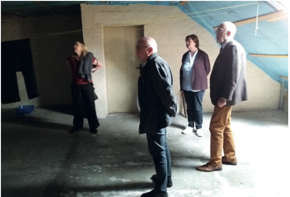
Ungenutzter Dachboden im Haus Hannover wurde zu einer kleinen Wohnung ausgebaut

Auch über die energetische Ertüchtigung macht sich der Vorstand Gedanken. In beide Häuser kann keine Wärmepumpe eingebaut werden, weil es keine Zentralheizung gibt. Da wird man in Zukunft auf andere intelligente Lösungen setzen müssen. Vor Jahren schon ist das Haus in Celle mit einer Dämmschicht umgeben worden.