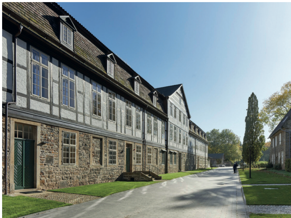
Predigerseminar Kloster Loccum