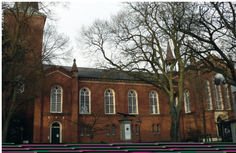
Meine Heimatkirche - kaum klimaneutral zu bekommen